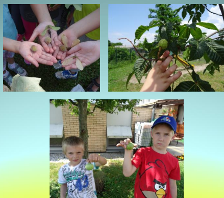
PLODOVI SE DEBELIJO, VENDAR ŠE NISO DOZORELI