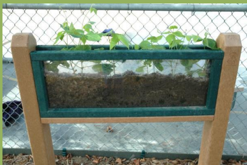
Preprost opazovalnik kalitve fižola