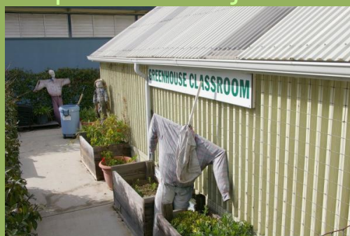
Preprost laboratorij na vrtu