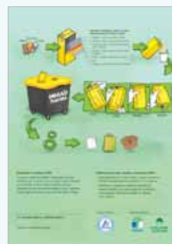
Zadnja stran mape »Ravnaj pravilno!«, ki ste jo prejeli na nacionalnem srečanju ekokoordinatorjev.