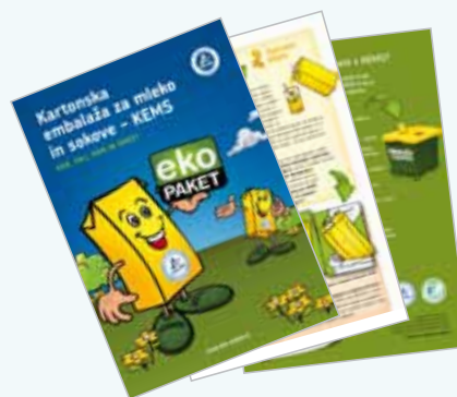
Brošura »KEMS – kdo, kaj, kam in kako?« http://www.eko-paket.si/upload/file/Ekopaket_brosura_2010-11_po%20straneh.pdf