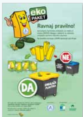
Plakat »Ravnaj pravilno!« http://www.eko-paket.si/upload/file/Ravnaj_pravilno.pdf