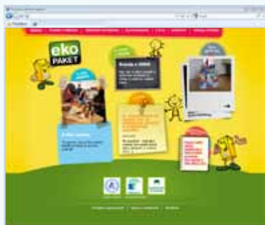
Spletno mesto Eko-paket www.eko-paket.si